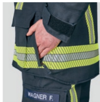
1409504 Bolsillo cómodo