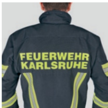
140949 Inscripción posterior